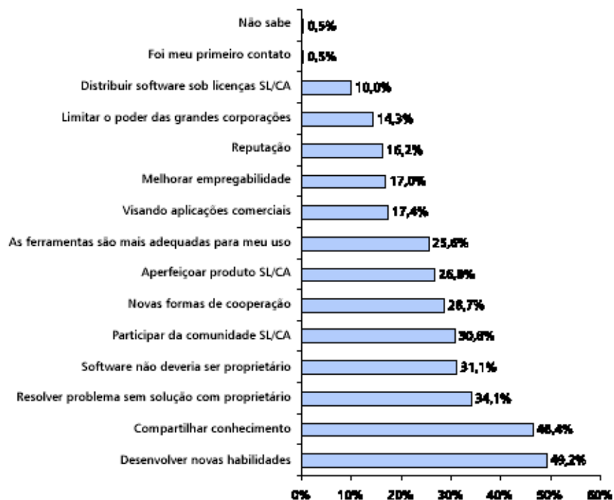
Figura 2.1: Razões de desenvolvimento e/ou distribuição de SL/CA, respondido por desenvolvedores.

A literatura sobre o tema “motivações de usuários e desenvolvedores de SL/CA” é vasta. Em geral, as opções de motivações apresentadas aos entrevistados envolvem aspectos técnicos, ideológicos, sociológicos e econômicos.