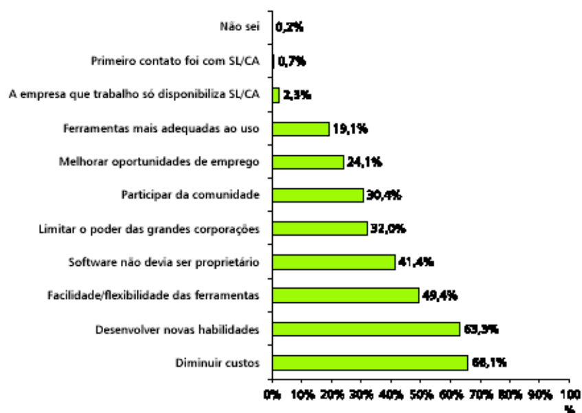
Figura 2.2: Razões de desenvolvimento e/ou distribuição de SL/CA, respondido por usuários.

seguida aparece uma motivação de ordem técnica: “resolver problema sem solução com o software proprietário“. Segue-se uma motivação de natureza ideológica: “software não deve ser proprietário“. Vale ainda comentar duas motivações de natureza econômica: “melhor empregabilidade“ e “aplicações comerciais“, ambas com baixa colocação no ranking da enquete. Já para os usuários os resultados foram um pouco diferentes.